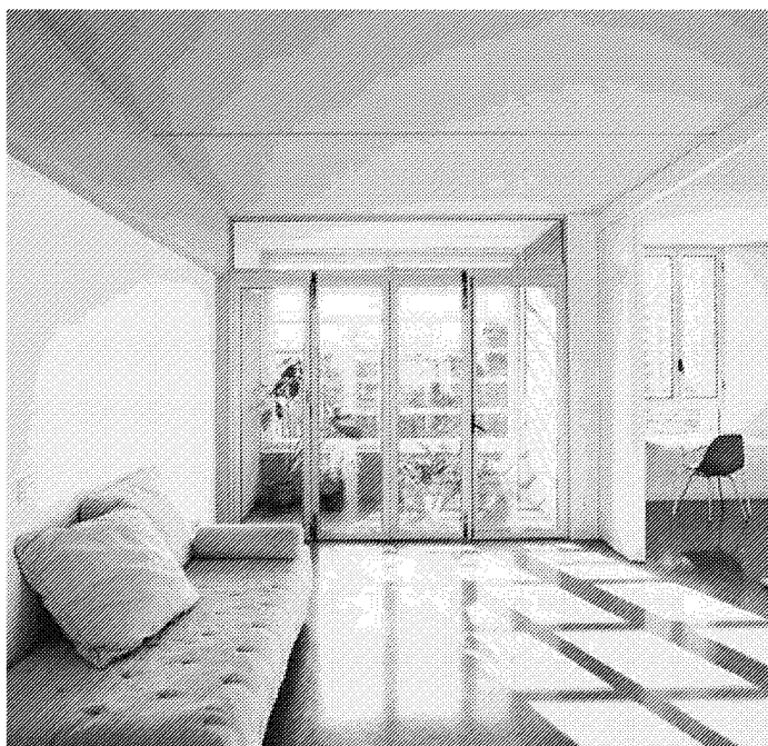
Interior d'un dels 27 habitatges de l'edifici premiat.